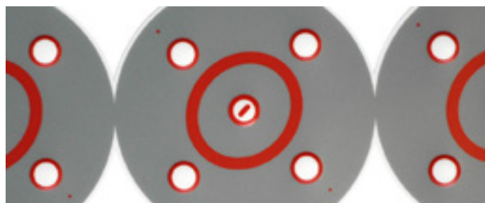
Abb.: Ausschnitt bedruckte Folie

Die Bedruckung mit klaren Fensterlacken auf der Dekoroberfläche kann mittels UV-Lacken erfolgen. Dabei werden Sichtfenster mit außergewöhnlich hoher Lichtdurchlässigkeit, Klarheit und ruhiger Lackoberfläche erzielt – eine gute Ablesbarkeit von Displays und LED-Anzeigen ist gegeben. Die Brillanz von Siebdruckfarben ist sehr hoch und die Randschärfe gedruckter Linien und Symbole sehr gut. Des Weiteren ist eine Nachhärtung der Folie nicht notwendig, ggf. erhöht sich dadurch die Chemikalienbeständigkeit.